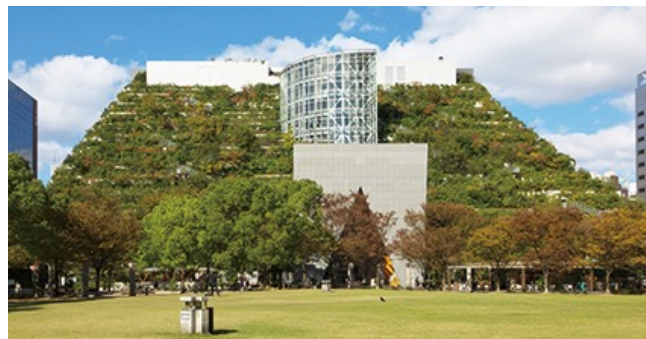
ステップガーデン